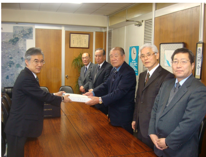
2月15日、組合設立認可図書授与の様子 (名古屋市役所 住宅都市局長室にて)

「発起人会だより第15号」でもお伝えしましたが、平成20年2月15日に組合設立が認可され、土地区画整理事業がスタートしました。