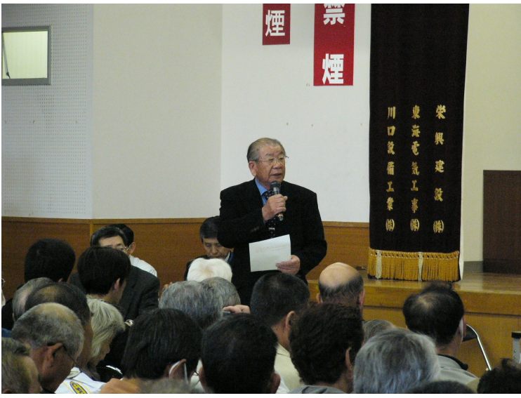
設立認可申請者代表あいさつの様子

第1回総会の議題は、「役員を選出について」及び「平成19年度予算について」です。