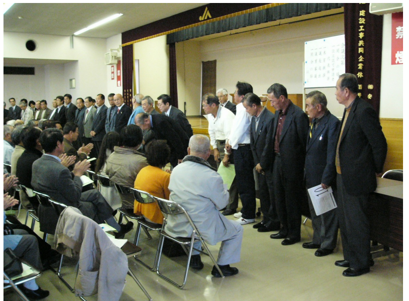
選出された役員を紹介の様子