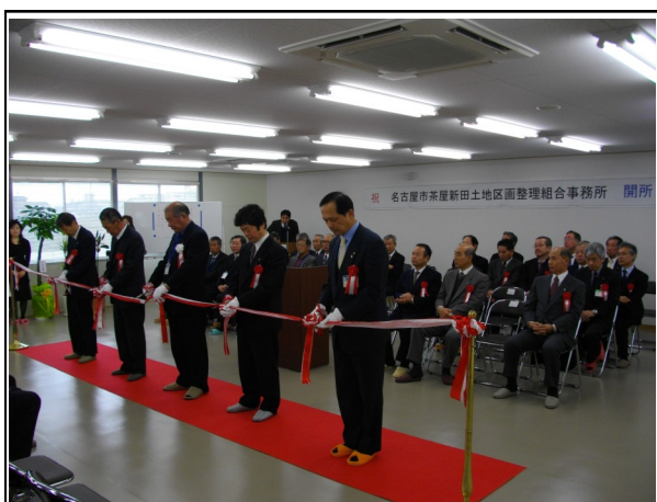
平成21年1月19日 開所式の様子

1月19日、公職者、行政、施工業者、総代の皆様方をお招きして、新事務所の開所式を行い、多くの方よりお祝いの言葉をいただきました。多くの方が本事業に対して大きな期待感を持っていることを実感しました。その期待にお応えできるよう、今後この事務所を拠点として、事業を進めてまいります。