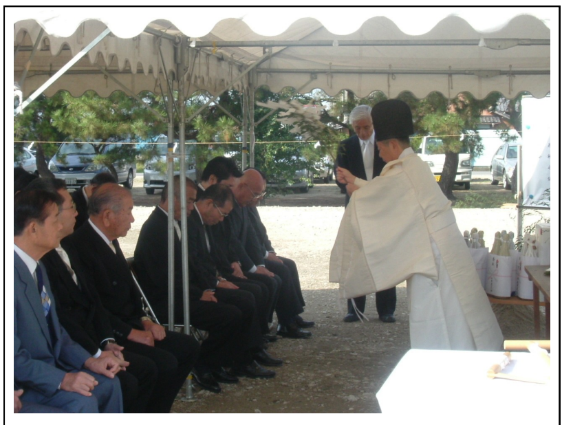
平成20年10月30日 地鎮祭の様子

事務所建設に必要な諸手続を経て、10月30日、浅間社の宮司様のご協力により、地鎮祭を行い、工事の安全祈願をしました。それから、平成20年中の完成、引越しを目標に急ピッチで事務所建設を進めました。