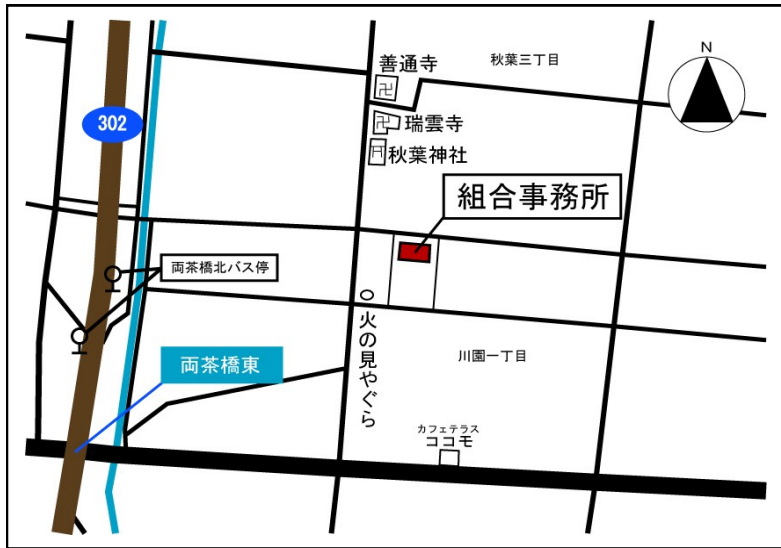
新組合事務所の位置

本組合は、これまで、茶屋新田土地改良事務所の2階をお借りして事務所としてまいりましたが、長期にわたる事業であること、施行地区内に事務所を設置するほうが適当であることから、新組合事務所の建設を進めてまいりました。建設地は川園一丁目の秋葉神社近く、火の見やぐらの東側です。