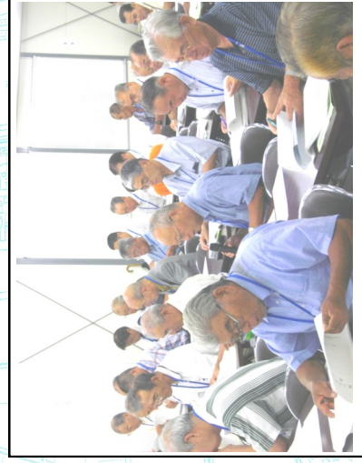
総代会 質疑応答の様子

※ 次回総代会は、12月12日(土)の午前10時からの予定です。後日、正式に通知いたしますが、総代の方におかれましては予定をしておいてください。