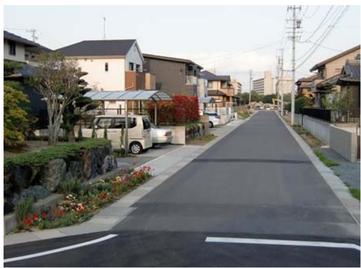
街並み整備の進む川原地区の状況

↓適切に造成できていない案件があり、一部の方にはご迷惑をおかけしています。そのような生産緑地については、個別に相談させていただきたいと思っています。