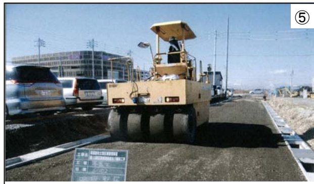
⑤ 区画道路築造・舗装工事 今後は生活道路の工事が中心になってきます。事業の早期完成のため、みなさまのご理解とご協力をよろしくお願いいたします。