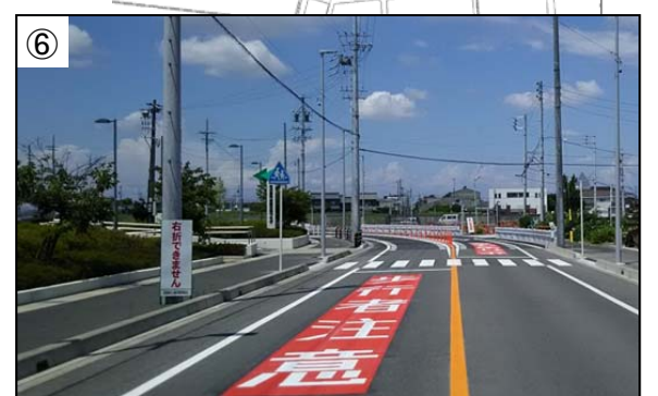
⑥ 南秋葉線 南陽交流プラザ前 地域のみなさまの要望が強かった横断歩道を設置することができました。