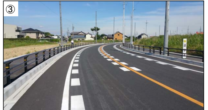
③ 都市計画道路築造・舗装工事 4月に南秋葉線と東茶屋線が開通し、西茶屋線の一部を除いて全線開通しました。今後は歩道のグレードアップを進めます。