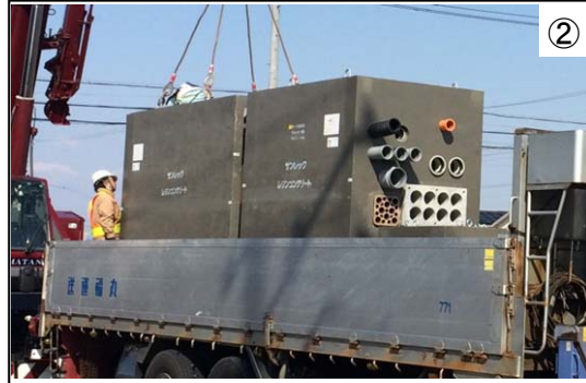
② 電線共同溝設置工事 南秋葉線と万場藤前線について、電線類の地中化等のために、電線共同溝設置工事を進めています。