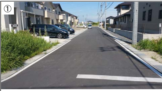
① 大西地区集合保留地 新しい住宅が次々に建設されています。