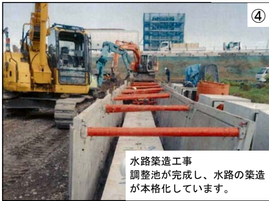
④ 水路築造工事 調整池が完成し、水路の築造が本格化しています。